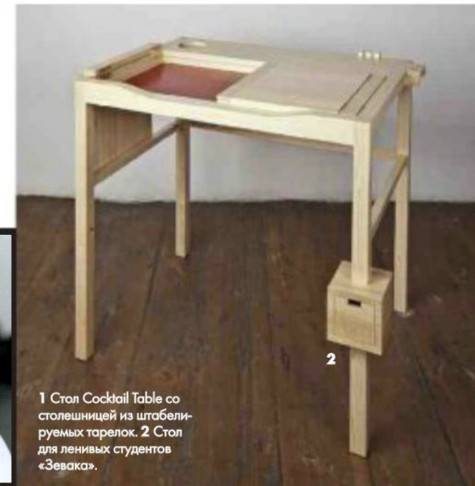
1 Стол Cocktail Table со столешницей из штабелируемых тарелок. 2 Стол для ленивых студентов «Зевака».